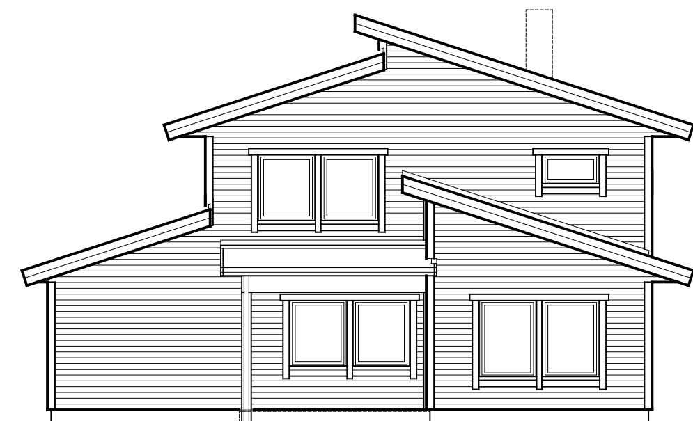
FASAD MOT NÖRDVÄST