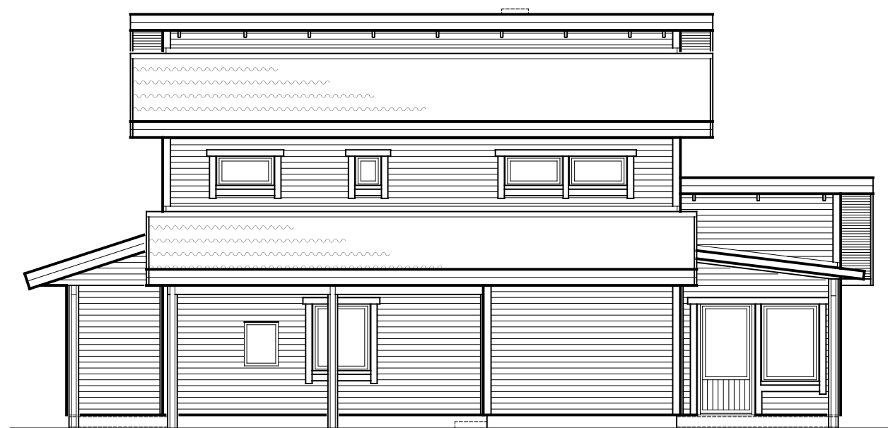
FASAD MOT NÖRÖDÖST